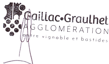
Le Président, Paul SALVADOR

Conformément aux articles R421-1 et suivants du Code de justice administrative, la présente décision pourra faire l'objet d'un recours gracieux auprès de l'autorité territoriale dans un délai de deux mois à compter de sa publication ou de sa notification. La décision peut faire l'objet d'un recours devant le Tribunal administratif dans les deux mois à compter de sa publication ou de sa notification. Le tribunal administratif peut être saisi grâce à l'application informatique Télérecours, accessible par le lien : http://www.telerecours.fr .