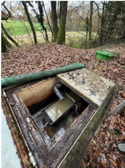
=> Auget baculant

Aucun prélèvement ponctuel d'eau traitée n'a pu être effectué par le SATESE, en vue d'analyses.