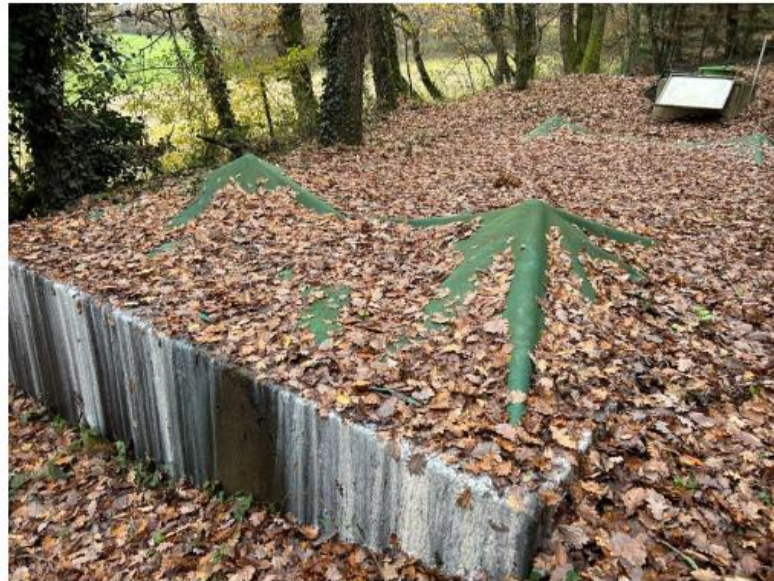
=> Massif filtrant colmaté