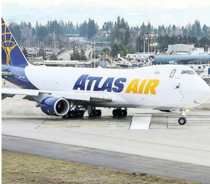
Le dernier Boeing 747 a été livré mardi aux États-Unis.