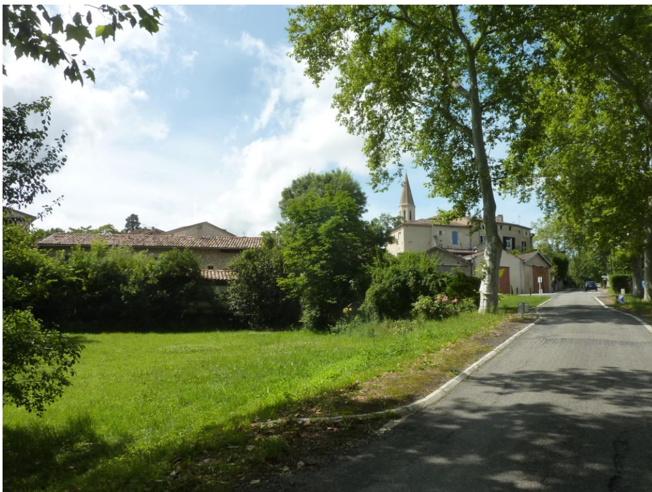
Vues du cône n°1