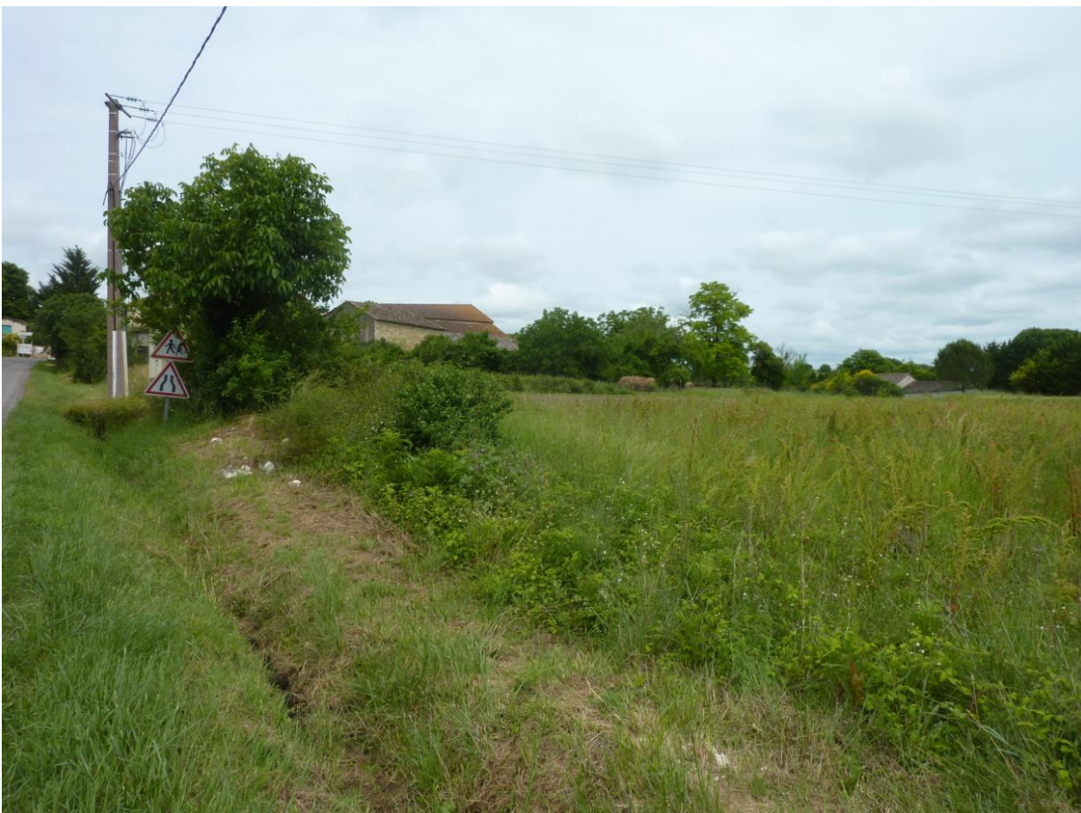
Vues dans le cône n°2