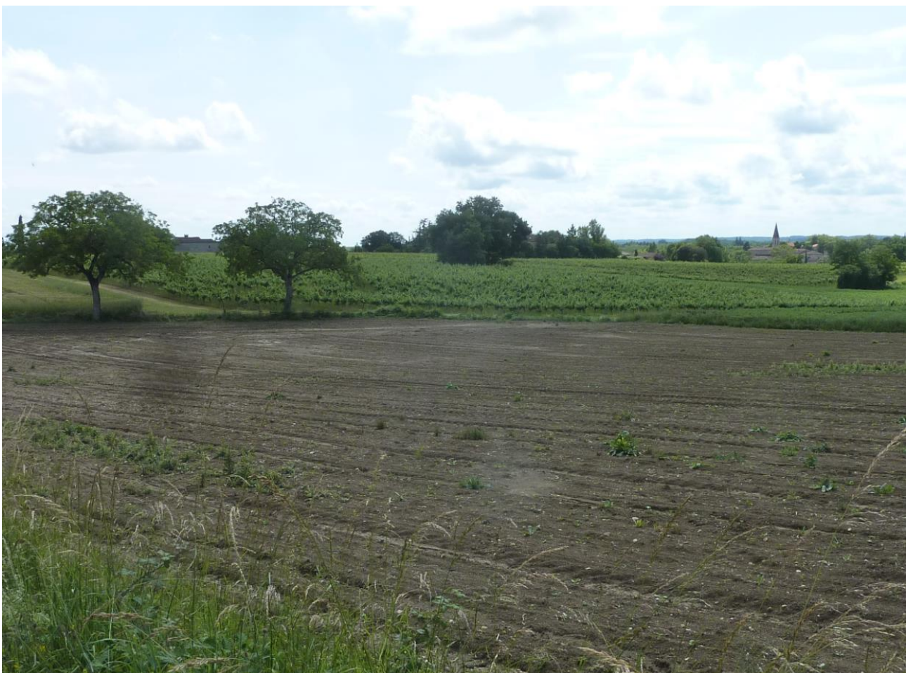
Vues dans le cône n°6