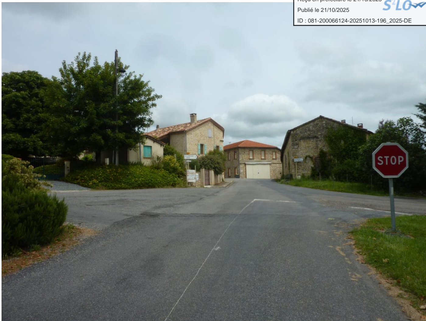
Vue dans le cône n°3