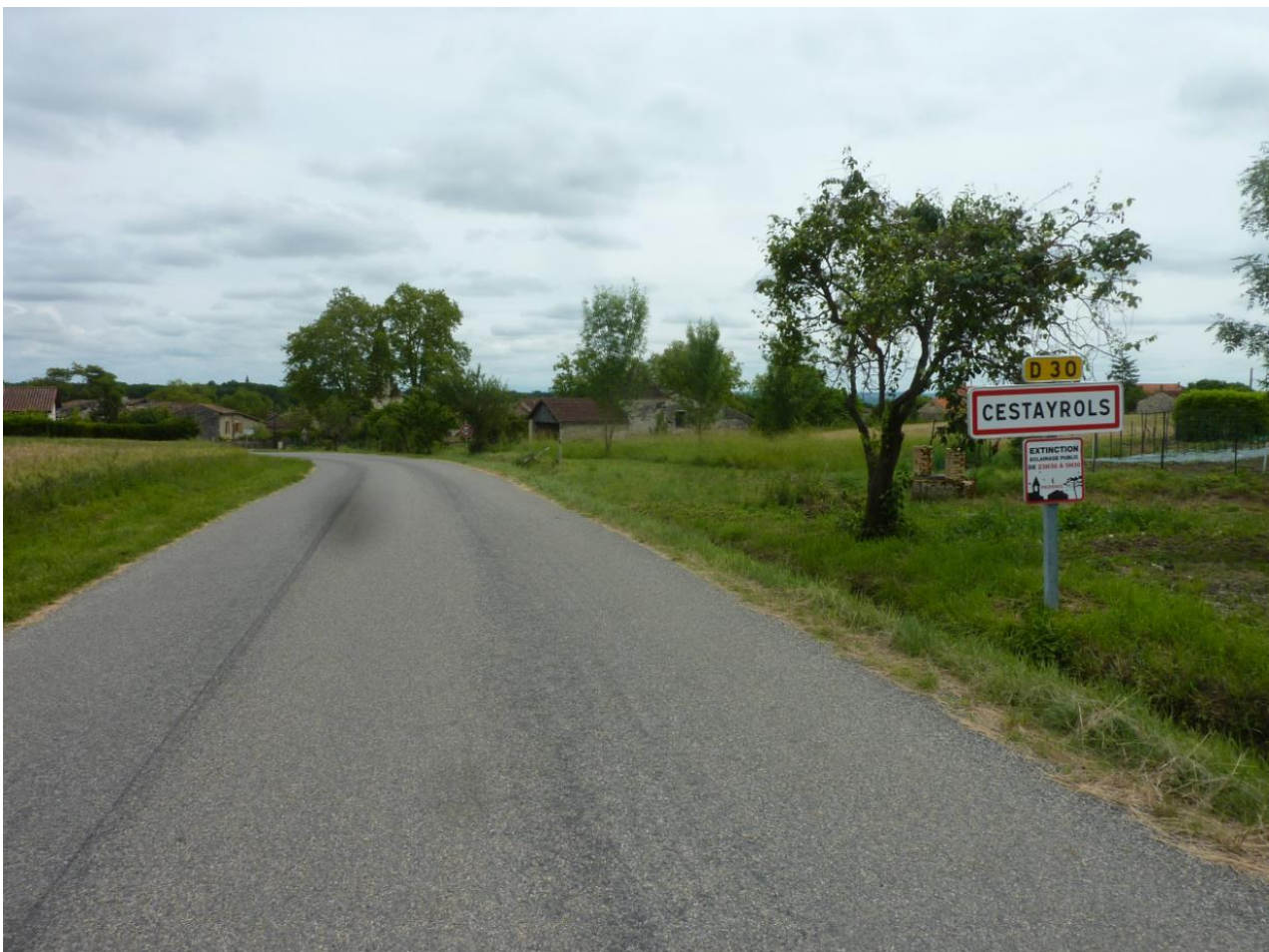
Vues dans le cône n°4