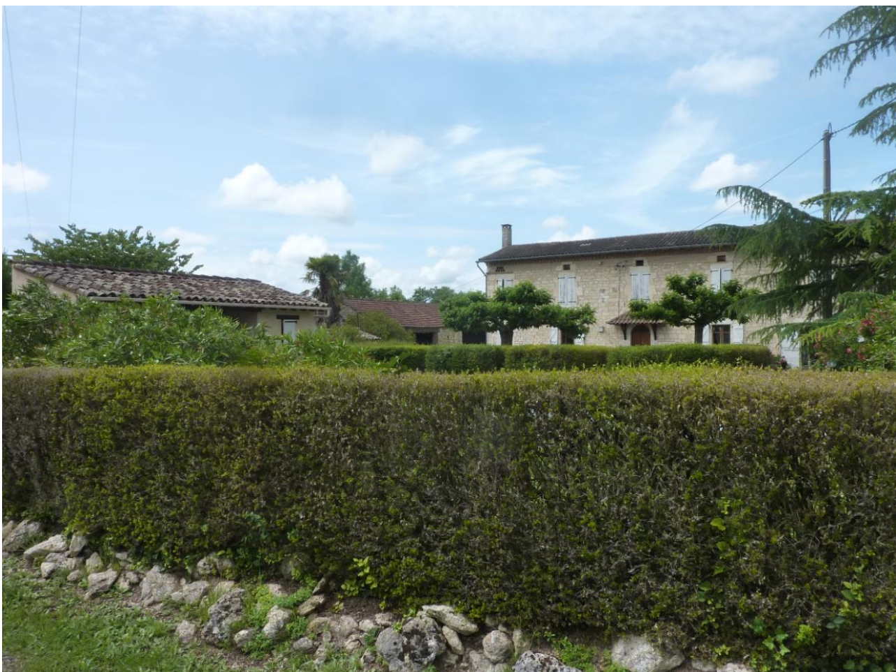
Vues dans le cône n°8