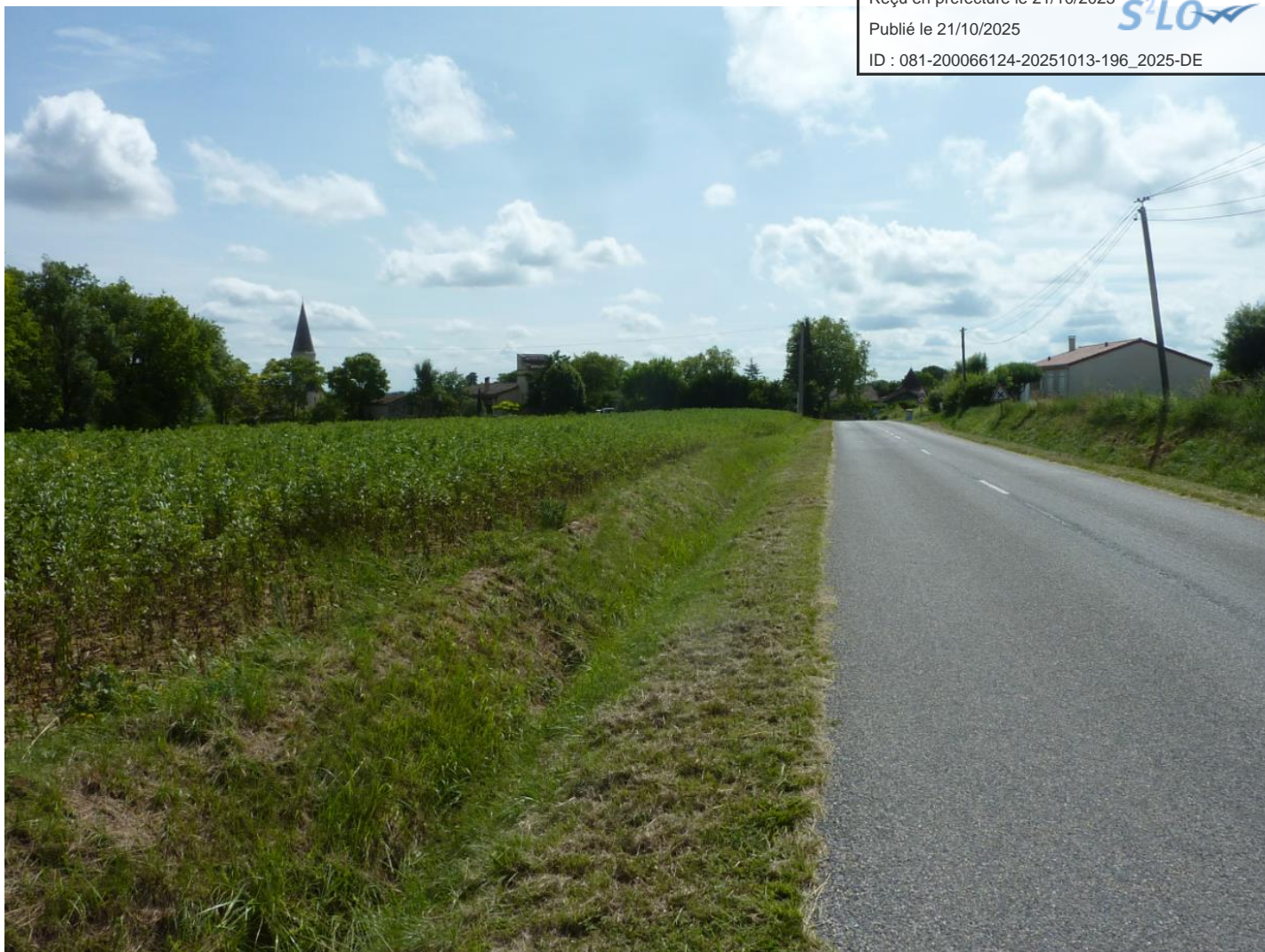
Vue dans le cône n°5