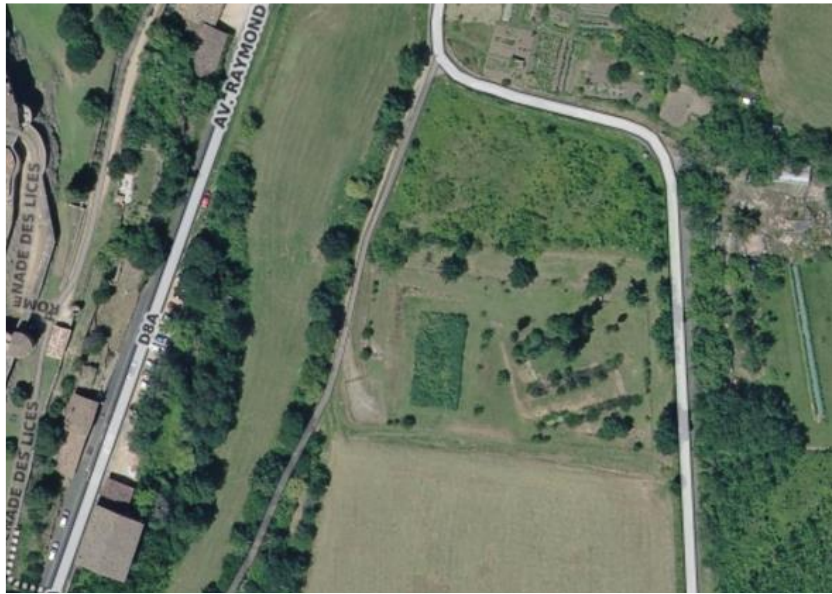
Photo de situation